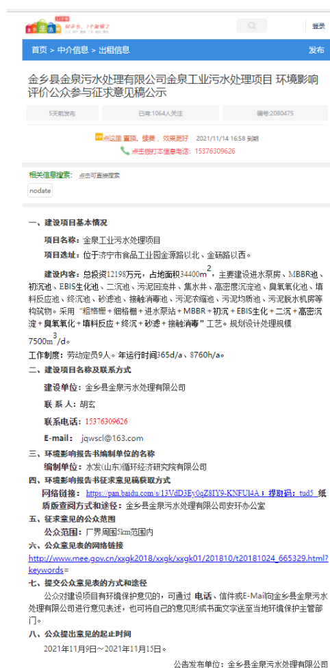
图 3.2-1 征求意见稿网上公示照片

本项目在金乡生活网( http://m.jinxiang114.com/114_m_zj.asp?id=144 )于2021年11月9日~2022年11月14日进行了环境影响报告书征求意见稿信息公示，符合《环境影响评价公众参与办法》的要求。公示截图见图3.2-1。